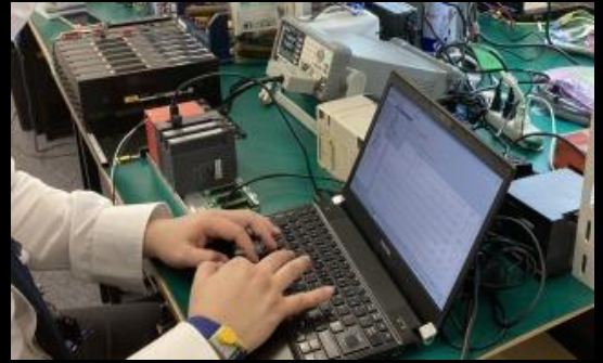
TECHNICAL BASE 幕張

古い装置の場合、製造メーカーでも既にプログラムデータがない、サポート期間終了のため対応しない、装置をわかる技術者がいない、そもそもメーカーが倒産等により存在しないといった事も多く、プログラムデータのインストールメディアやバックアップデータがない為に、装置が復旧できなくなる問題が数多く発生しています。